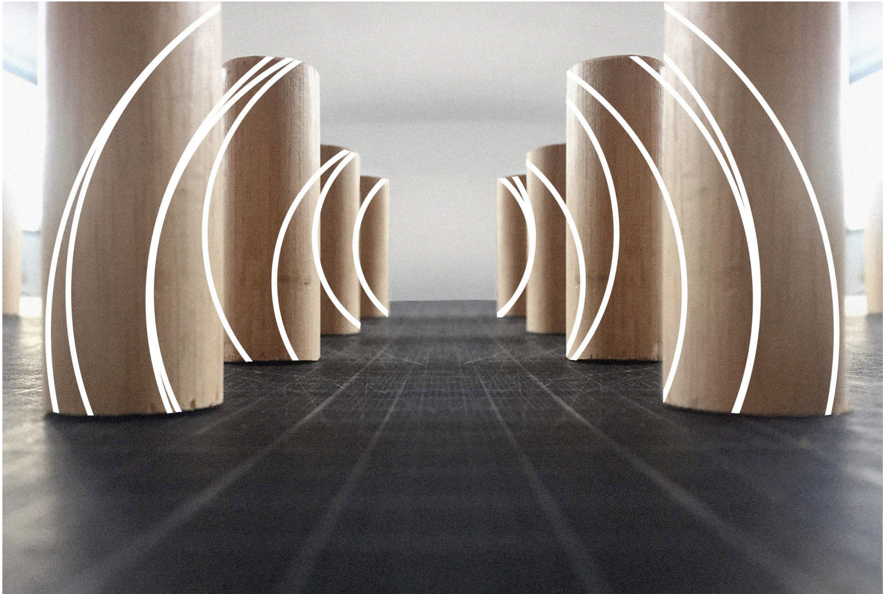
Projet : «Huit cercles fragmentés» - Point de vue B